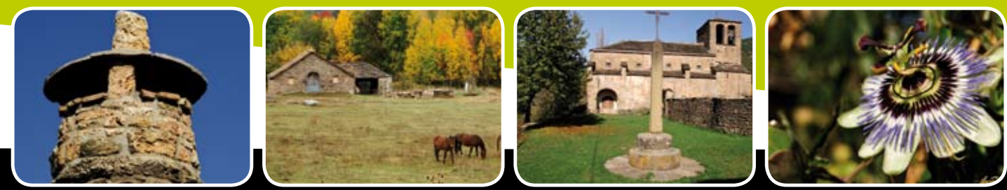
Comarca Hoya de Huesca | Plana de Huesca

COPA DE ARAGÓN (absoluto, veteranos/as y promesas sub-26) 3 mayo >> Iglesia del Cid (A.D. El Maestrazgo). 31 mayo >> Talamantes (Ayuntamiento de Talamantes y Club Senderismo Horcajuelo) / CAMPEONATO DE ARAGÓN (absoluto, por clubes y sub-26). 28 junio >> Peña Montañesa (Club Atletismo Sobrarbe) / COPA DE ESPAÑA Y FINAL - TRAIL COPA DEL MUNDO 27 septiembre >> Oturia (Grupo de Montaña Sabiñánigo)